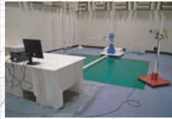
放射電界強度試験